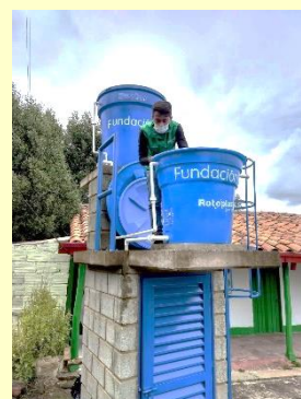
Puesta a punto de la planta de potabilización de agua. Se ve al técnico encargado acondicionando la planta.

La Fundación EPM pone en funcionamiento una planta de potabilización de agua en la sede educativa. Esto representa un avance para la comunidad educativa dado que ahora los estudiantes podrán consumir agua potable tratada. Con esta planta de potabilización, EPM contribuye a mejorar el Plan de Saneamiento Básico de la comunidad educativa y le da un espaldarazo a la propuesta pedagógica que ha venido implementando la sede para formar hábitos de vida y alimentación saludable.