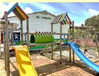
Institución Educativa Marco Tobón Mejía – Sede El Vergel, 2021

Se preguntarán por qué el aula de sistemas se convirtió en bodega. Es probable que muchas personas en la vereda El Vergel no se hayan dado cuenta aún de las situaciones desafortunadas por las que pasó la sede durante el tiempo de confinamiento al que fuimos obligados por la pandemia que provocó la Covid-19. Y es aceptable que no todos los habitantes se den cuenta de lo que sucede a su alrededor, pero lo que no es admisible es que no se den cuenta de lo que suceda en un punto de referencia tan fuerte como lo es una sede educativa, una escuela o colegio. Nuestra sede fue perpetrada por “dueños de lo ajeno”, quienes ingresaron al lugar hurtando nueve computadores portátiles, un Smart TV (televisor inteligente) y un computador de escritorio. Todos estos elementos eran utilizados en los procesos de enseñanza de los estudiantes de la sede. Se trata de recursos pedagógicos que eran puestos a disposición de los estudiantes para que pudieran realizar consultas, interactuar con el conocimiento, jugar al tiempo que aprendían a usar estos recursos tecnológicos. Y dado que estos fueron hurtados, la sala de sistemas se ha convertido en bodega, en un espacio de almacenamiento de muebles, cillas, escritorios y demás herramientas que son tecnológicas, pero que solo sirven para el embellecimiento institucional, aseo y mantenimiento, nada más.